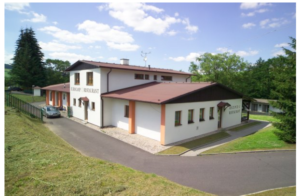
Restaurace Eurocamp Běšiny

Délka úseku: 6.870 m Povrch: asfalt Pro typ kola: silniční