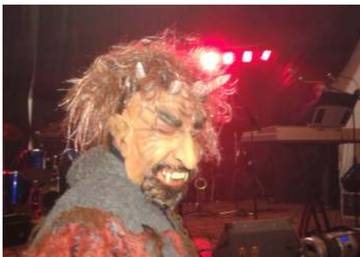
Jeden z čertů - jméno necháme jako kvízovou otázku pro čtenáře. Své tipy zasílejte na zpravodaj@besiny.cz.