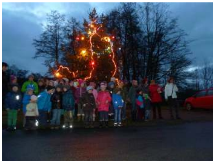
Rozsvícení vánočního stromečku.